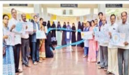
మధుమేహంపై అవగాహన కార్యక్రమం