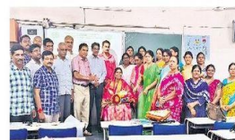
విజయలక్ష్మిని సన్మానిస్తున్న అధ్యాపకులు

15/11/2024 | YSR Kadapa (Kadapa City) | Page : 9