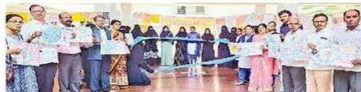
కార్యక్రమంలో పాల్గొన్న నేడ్కులు, అధ్యాపకులు, ఉపాధ్యాయులు, విద్యార్థినులు

Date : 13/11/2024 EditionName : ANDHRA PRADESH ( YSR ) PageNo : 04